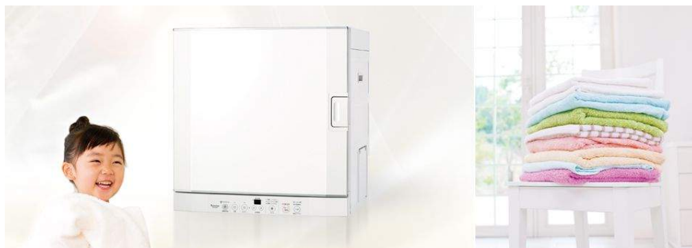
(写真:リンナイ製ガス乾燥機 乾太くん)

コインランドリーをご利用されている方は必見！コインランドリーへ行く手間が省けて、なおかつ低コスト。仕上がりはコインランドリーと同様の仕上がりが期待できます。堂下家でももちろん利用しています(^_^)