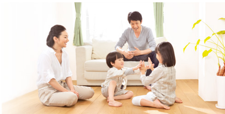
床暖房で家族のだんらんを増やしませんか(^^)

「床暖房をしたいけどランニングコストが…」とお悩みの方は多いのではないでしょうか？ハイブリッド給湯器を利用した床暖房はランニングコストを抑えることができます。立ち上がりはガス、その後の一定温度での温水循環は電気を利用することで、効率よくかつ暖かくを実現しました！